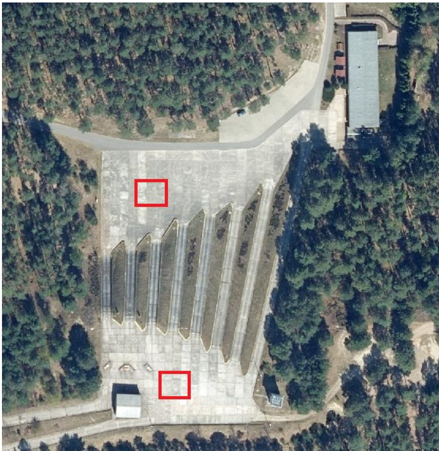
Abb. 1: Notabbrand-Flächen auf Kopf- und Fußplatte der Steigungsbahnen