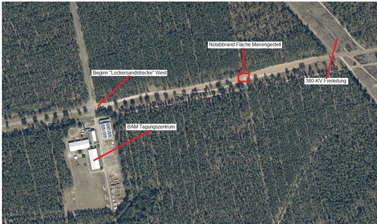
Abb. 3: Notabrand-Fläche Mariengestell auf „Lockersandstrecke“ 350 m östlich „BAM-Tagungszentrum“