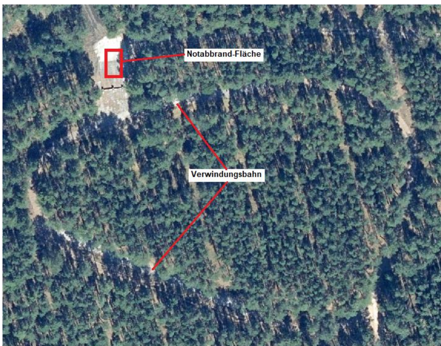
Abb. 2: Notabbrand- Fläche im Bereich der Verwindungs- bahn: Vorplatz nördlich der Kletterstufen